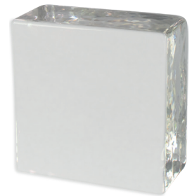
seidenmatt (nur Rückseite)